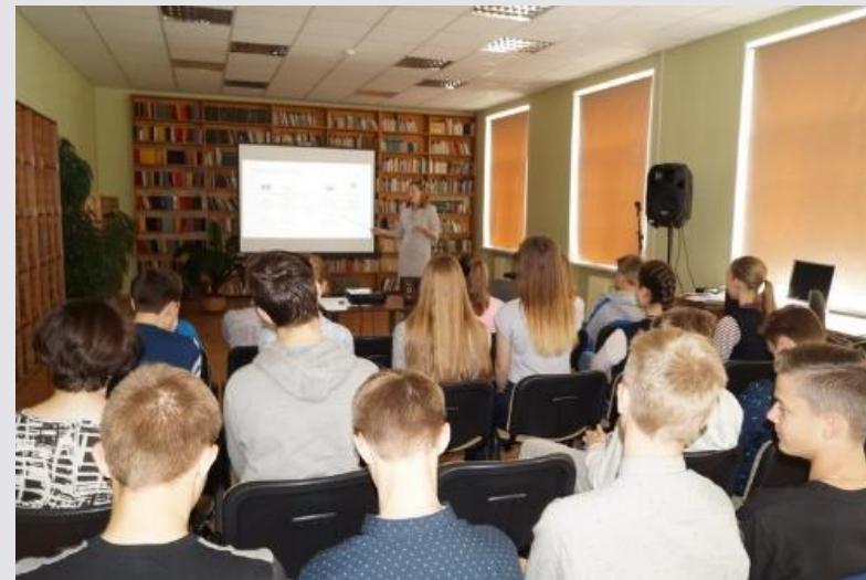
Novadmācības stunda «Daugavpīlieši Latgales latviešu kongresā»