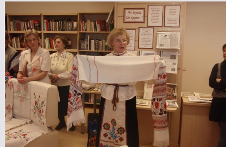
Interaktīvs pasākums «No šūpuļa līdz kapiem...»