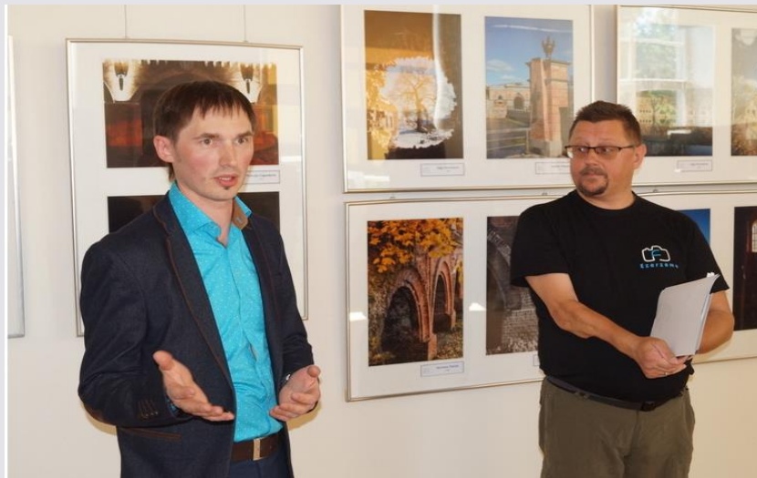
Fotoizstādes «Daugavpils cietoksnis» atklāšana