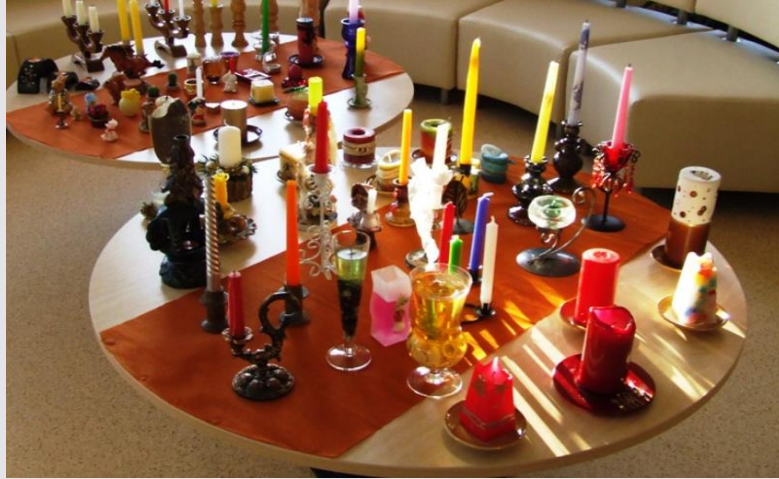
Interaktīvs pasākums «Kā svece deg...»