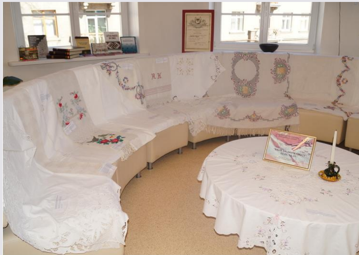
Fragments no izstādes «Baltā galdauta stāsts»