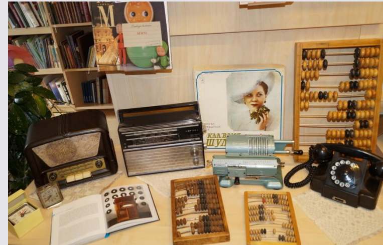
Senlietu interaktīvā izstāde «Tā mēs kādreiz dzīvojām...»