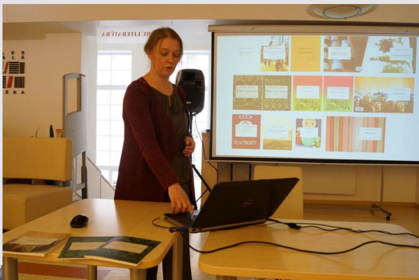
Starpnozaru mākslas grupas SERDE rīkotā «Novadpētniecības laboratorija»