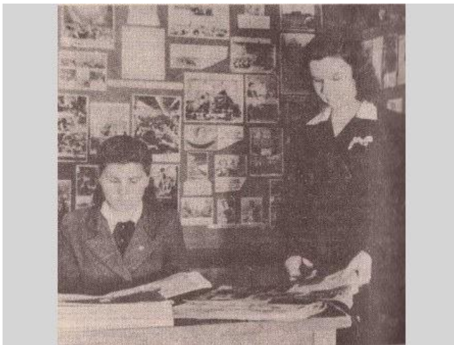
Pilsētas bibliotēka. 1949. g.