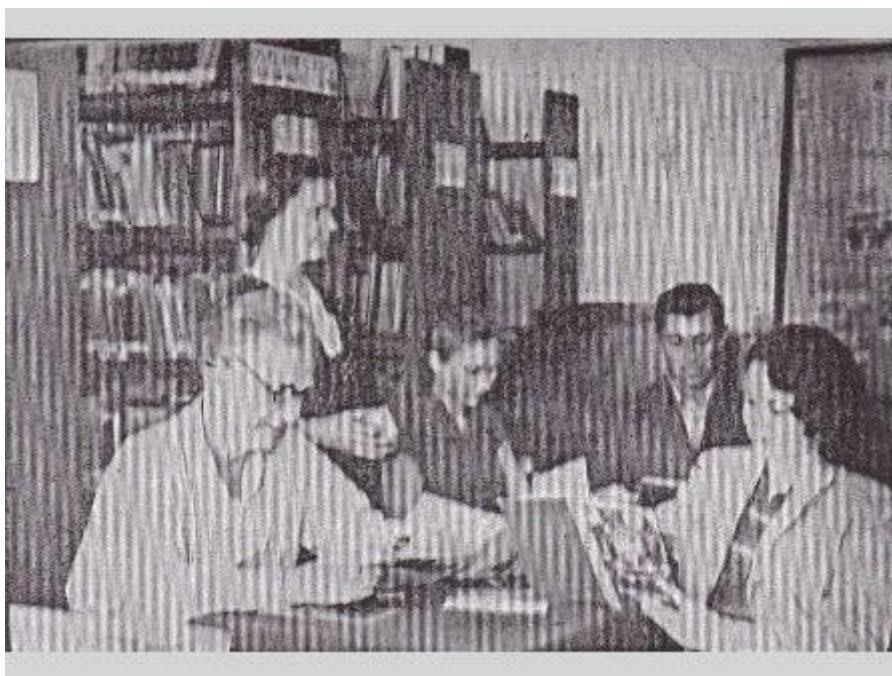
Pilsētas bibliotēkas lasītāju zāle. 1960. g.

Bibliotēkā ieviesta jauna lasītāju apkalpošanas forma – atklāta pieeja grāmatu fondam. Līdz šim bibliotēka savus lasītājus ar grāmatu fondu iepazīstināja tikai ar katalogu, bibliogrāfisko apskatu un grāmatu izstāžu palīdzību.