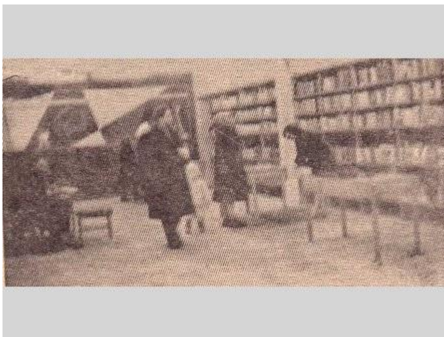
Grāmatu nams. Grāmatu veikals. 1964. g.

Rēzeknieši saņem lielisku dāvanu – Grāmatu namu Padomju ielā (tagad Br. Skrindu 17). Pirmajā stāvā – grāmatu veikals, plauktos tūkstošiem grāmatu. Otrajā stāvā pārceļas pilsētas bibliotēka.