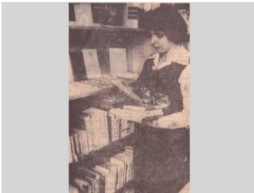
Rēzeknes pilsētas Centrālā bibliotēka. 1978. g.

Šajā gadā republikā notiekošās tautas bibliotēku centralizācijas ietvaros trīs Rēzeknes pilsētas tautas bibliotēkas apvienojas, izveidojot vienotu Rēzeknes pilsētas centralizēto bibliotēku sistēmu. Rēzeknes pilsētas 1. bibliotēka kļūst par Rēzeknes pilsētas Centrālo bibliotēku.