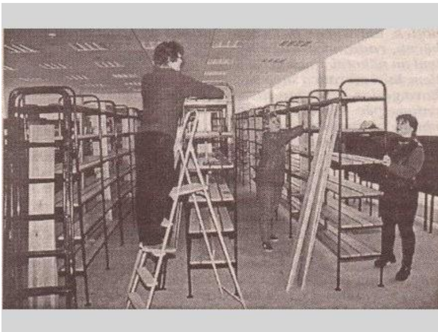
Rēzeknes pilsētas Centrālās bibliotēkas abonements. 2000. g.

Pēc vairāk nekā četrus mēnešus lasītāju apkalpošanas darba pārtraukuma 9. jūnijā svinīgi tiek atklātas pilsētas centrālās bibliotēkas jaunās telpas Atbrīvošanas alejā. No 12. jūnija to var apmeklēt arī lasītāji. Sadarbībā ar Norvēģijas sadraudzības pilsētu Ārendāli jaunajās telpās izvietots Norvēģijas informācijas centrs.