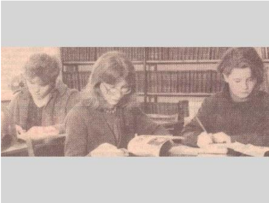
Rēzeknes pilsētas Centrālā bibliotēka. 1980. g.

Lasītavā iedibinās laba tradīcija ievērojamu cilvēku jubilejām veltīt nelielas izstādes.